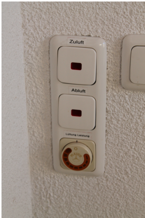
Ein-/Ausschalter und Regelung der Lüftung

Die Lüftungsanlage kann in der Küche eingeschaltet werden. Zu- und Abluft kann einzeln eingeschaltet werden. Die Leistung der Lüftung kann am Drehknopf darunter eingestellt werden.