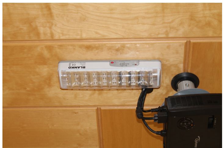
Notlicht im Hauptraum