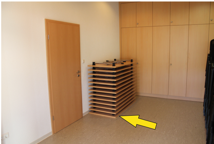
Lagerung der Tische im Nebenraum

Wichtig: Die Tische müssen mit der Tischplatte nach unten gestapelt werden, um Druckstellen im Boden zu vermeiden.