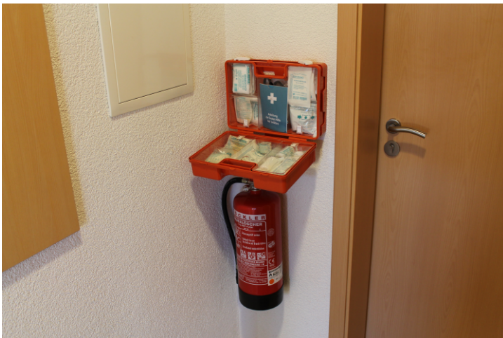
Erste-Hilfe-Koffer und Feuerlöscher im Vorraum

Sollte es zu einem Stromausfall kommen, ist im Hauptraum eine akkubetriebene Notbeleuchtung installiert. Diese schaltet sich automatisch bei einem Stromausfall ein.