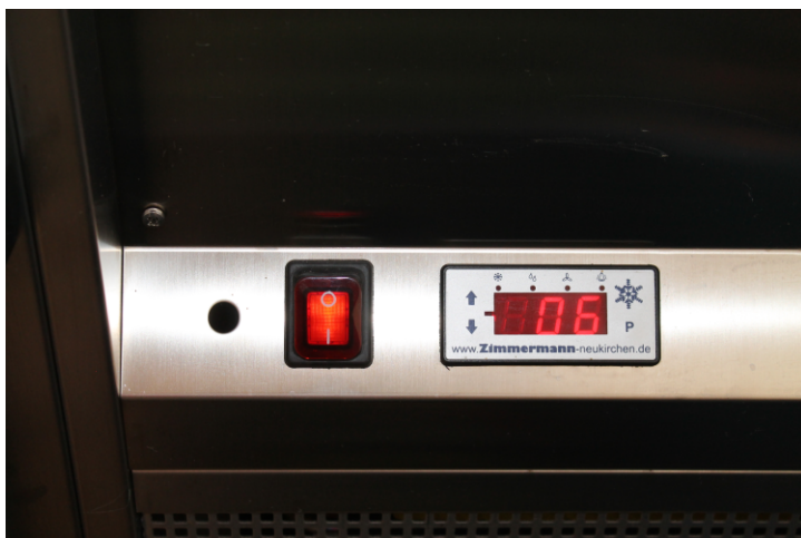
Ein-/Ausschalter und Regelung der Kühltheke

Bei der Reinigung der Theke muss auch die Abtropfwanne gereinigt werden. Hierzu bitte das Abtropfblech entfernen (Bild).