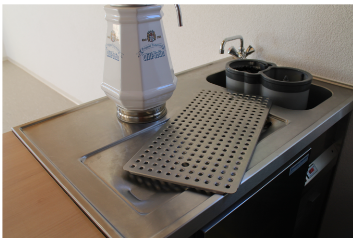
entferntes Tropfblech an der Kühltheke