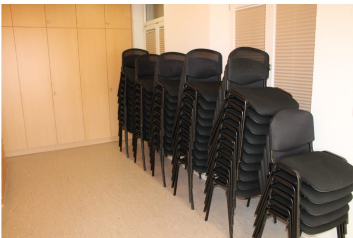
Lagerung der Stühle im Nebenraum